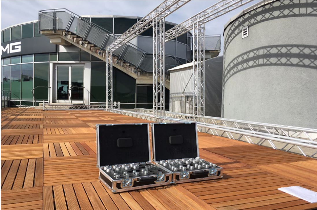
Abbildung 2: Zwei Starter-Kits, um vorhandene Truss-Systeme auf die Schnellverbindungssysteme nachzurüsten