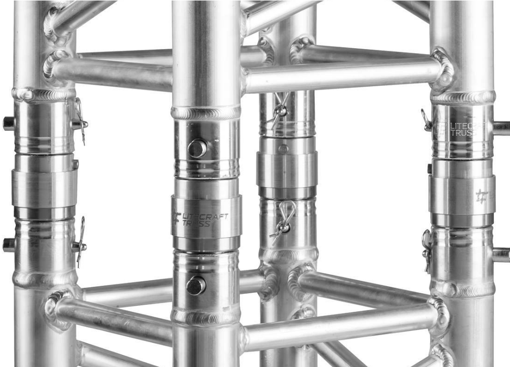
Abbildung 1: LITECRAFT TRUSS Klick made by RESBIG Schnellverbindungssystem für Aluminiumtraversen