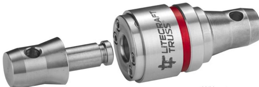
Abbildung 3: Schnellverbindungssystem LITECRAFT TRUSS Klick made by RESBIG für konventionelle Traversen als Adapterausführung mit Halbkonus

Die folgende Darstellung zeigt die o. g. Variante: